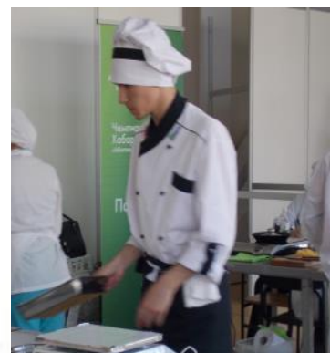
Автор: Хромова А.В., методист

Будущим участникам чемпионата «Абилимпикс» Сергей желает больше практиковаться в приготовлении блюд и не волноваться.